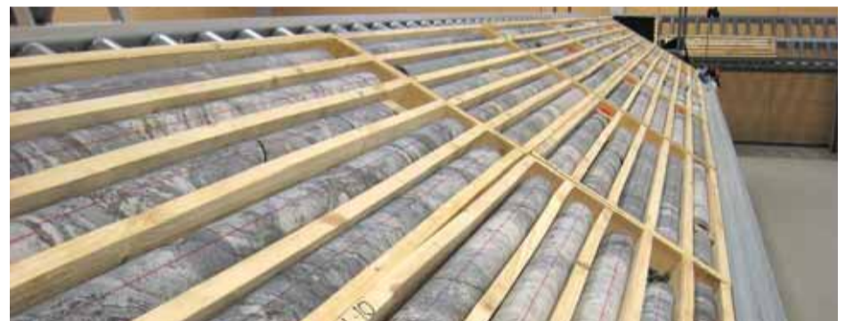
Pilottireikä 17:n loppuosan kivenäytteet odottavat Olkiluodossa tarkempia tutkimuksia.

Posiva keräsi tutkimustietoa pilottirei'istä heti niiden valmistuttua. Ensimmäisissä kartoituksissa selvitettiin kivilajeja sekä kallion rikkonaisuutta ja vesivuotoja ja tehtiin geofysiikan mittauksia.