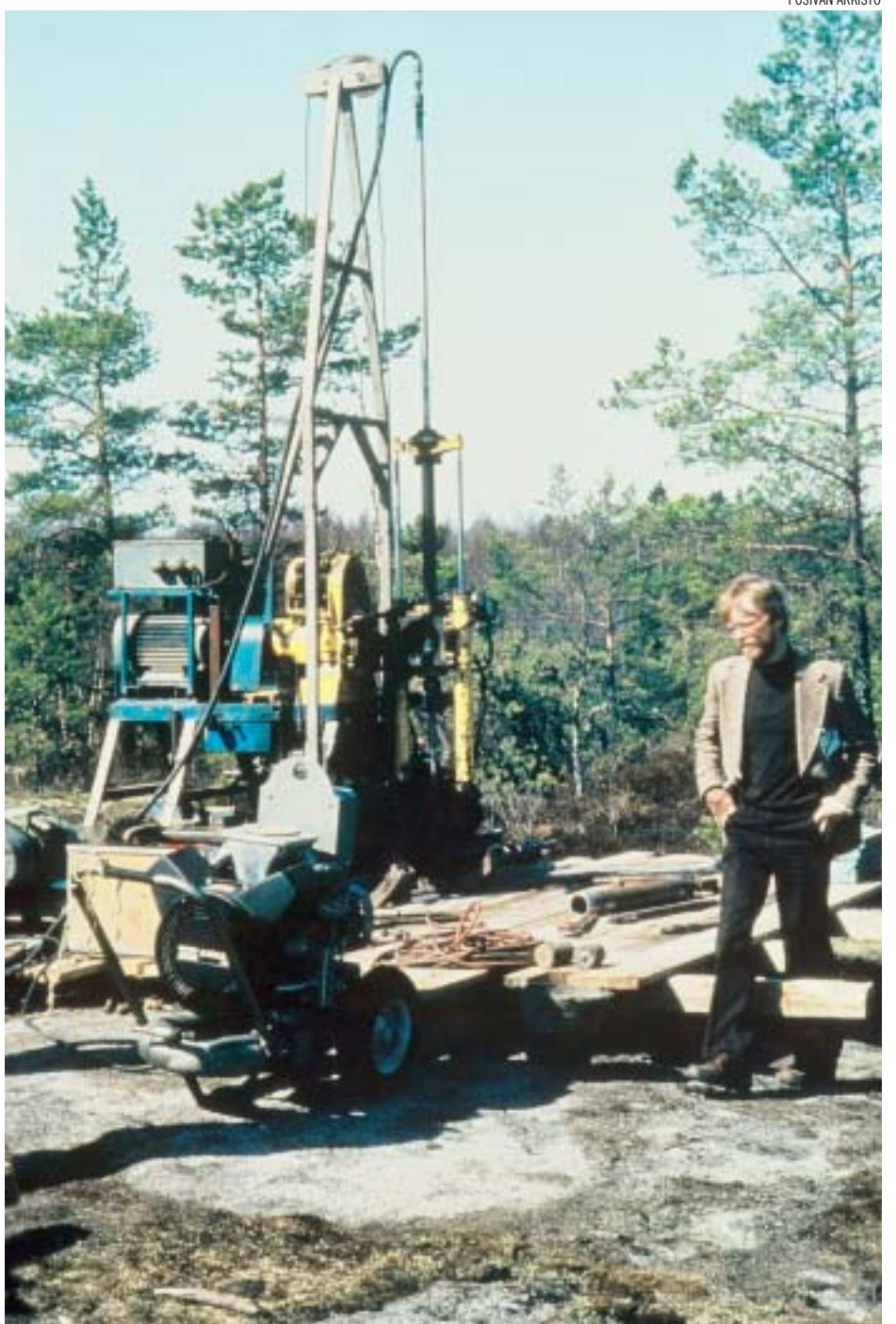
Koereiän poraaminen Lavian kunnassa vuonna 1984 aloitti loppusijoitukseen liittyvät kallioperätutkimukset.

Vaikka vuosien aikana tutkimustietous ja ymmärrys ovat karttuneet räjähdysmäisesti, suunnitelmat ovat säilyneet jopa yllättävän tarkasti TVO:n 1980-luvun alussa luoman ohjelman mukaan. Yksityiskohtia on hiottu, mutta monista muista maista poiketen Suomessa on pysytty aikatauluissa. Tähtäimenä oli heti alusta lähtien loppusijoituksen aloittaminen vuonna 2020.