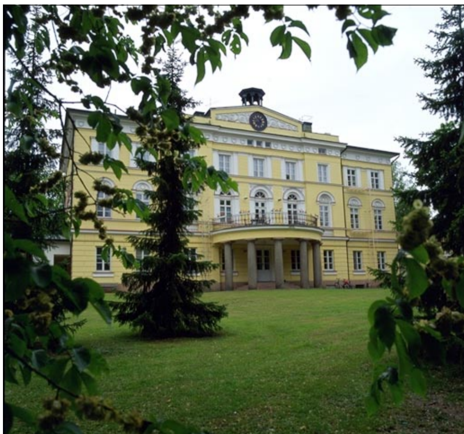
Vuojoen kartanon miljöölle ollaan löytämässä uusia käyttömuotoja.

antaa kartanossa tulevaisuudessa kulttuuriympäristötutkimuksen koulutusta. Yliopisto on saanut koulutuksen suunnitteluun rahoituksenkin."