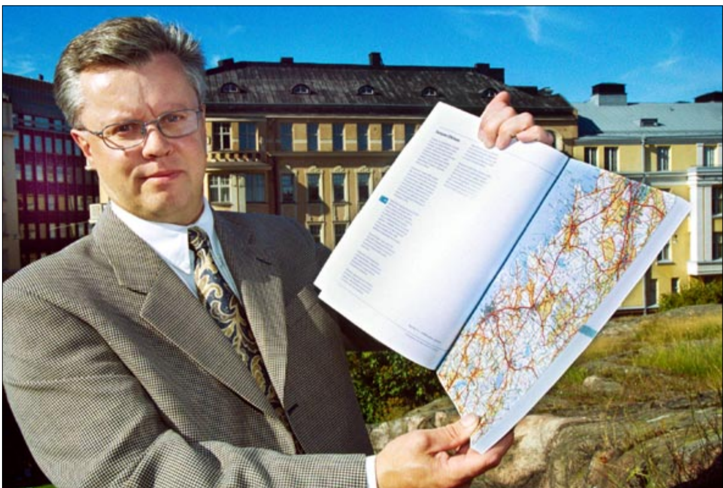
Ryhänen mielestä siirtyminen työpöydän äärestä maastoon, teoriasta käytäntöön, on ollut yksi tärkeimmistä loppusijoitusohjelmaa edistävästä työvaiheista.

Loppusijoitusta alettiin vakavissaan valmistella Suomessa 1980-luvun alussa, jolloin TVO alkoi selvittää mahdollisia tutkimuspaikkoja ja kehittää kalliitutkimustekniikkaa. Loviisasta run-