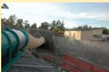
ONKALON sisäänmenoaukon oikealla puolella sijaitseva tunnelitekniiKKarakennus otetaan käyttöön kuluvaan syksyn aikana.

ONKALON tunnelitekniiKKarakennus valmistumassa. Maanalaisen tutkimustilan ONKALON tunnelitekniiKKarakennus valmistuu lokakuussa ja otetaan käyttöön vähitellen syksyn aikana. Tunnelin sisäänkäynnin välittömään läheisyyteen rakennettu tekniiKKarakennus tulee toimimaan maanalaisten tilojen valvomona sekä hälytys- ja viestikeskukseksi. TunnelitekniiKKarakennuksesta ohjataan kaikkia tunneliin asennettuja järjestelmiä kuten sähkönsyöttöä, ilmanvaihtoa ja erilaisien mittauslaitteiden toimintaa.