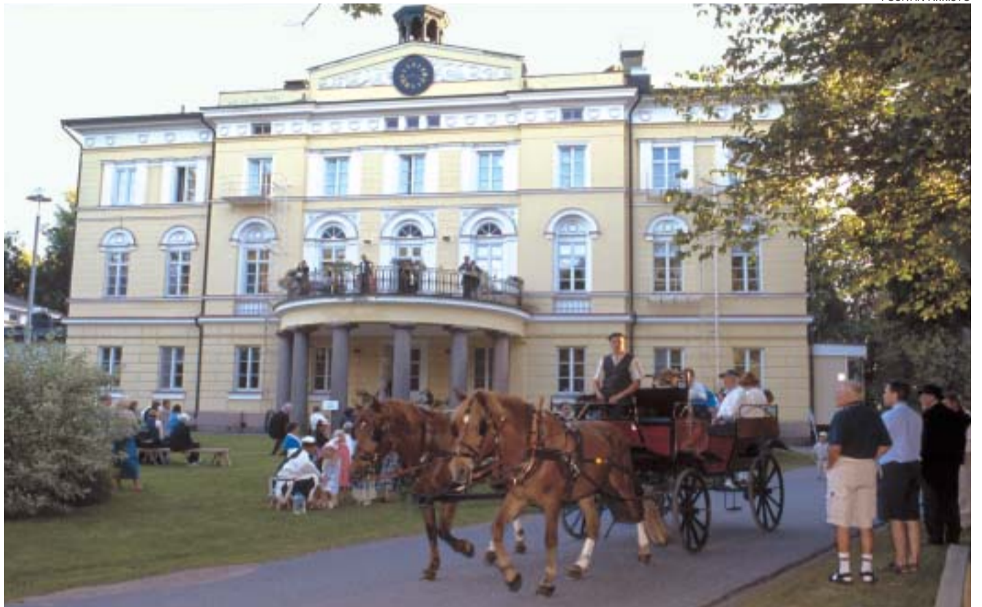
Uudistunut Vuojoen kartano tulee toimimaan useiden merkittävien tapahtumien näyttämönä, muun muassa perinteisen suviehtotapahtuman.

Kesällä 2004 käynnistyneet korjaustyöt etenivät alussa suunniteltua hitaammin, mutta aikataulu saatiin kurottua melkein kokonaan kiinni. Viivästymiset johtuivat siitä, että töiden edetessä paljastui asioita, joita ei voinut huomata etukäteen.