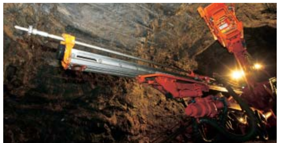
ONKALOn louhinnassa käytetään lähes 17-metristä ohjelmoitavaa porausjumboa.

Työmaalle on myös suunniteltu huolto- ja varastorakennuksen rakentamista. ONKALOn louhiminen ja tutkiminen vaativat uutta varastotilaa ja raskaan kaluston huoltotilaa.