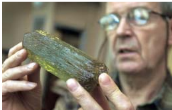
Luumäeltä löydettyä Elli-beryylliä pidetään Suomen kauneimpana kivenä.

Vaikka Suomen kallioperä ei ole maailman mittakaavassa millään lailla poikkeava, Lehtisen mukaan siinä riittää mielenkiintoista tutkittavaa. Yhtenä suomalaisena erikoisuutena hän pitää Siilinjärven karbonaattiin liittyvää apatiittimalmia. Erikoisuudeksi Lehtinen nostaa myös sen, miten tarkasti rapakivigraniitin syntyy Suomessa selvitetty.